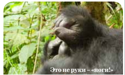
Это не руки – «ноги!»

серебряк Рухемуга (возрастом около 30 лет) упал с дерева и разбился. Видимо, не рассчитал толщину дерева. Вообще-то, по деревьям лазают только дети и подростки (фото 11). Наблюдая за гориллами, убедился, что они едят только листья и ветки деревьев (фото 12, 13)! И действительно, пока мы пробирались по непроходимому лесу – никаких особых съедобных плодов и ягод! Есть небольшой фруктик, похожий по форме и цвету на перчик со вкусом, напоминающим помидор (гориллы не едят), редко встречается ежевика. Все! Соответственно, при таких баритах они полдня едят листья, а оставшиеся полдня лежат, вяло шевелясь, экономя энергию. Даже подростки, возясь друг с другом в борьбе, делают по несколько движений с большими паузами! Картину такого отдыха удалось понаблюдать во второй семье – Кахунгье, примерно такой же численности. В процессе наблюдения они сами подошли к нам очень близко (фото 14). Серебряк лежал практически без движений, самки вычищали ему шерсть, подростки играли, несколько членов семьи питались самостоятельно,